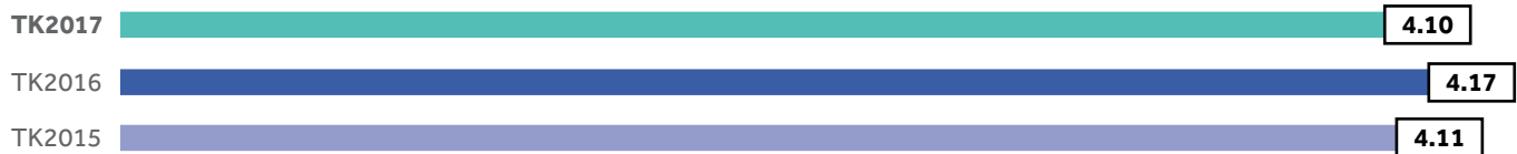
Perolehan Kumpulan (RM bilion)

Kami yakin bahawa melalui program transformasi, kami mampu memaksimumkan peluang pertumbuhan perniagaan eksport dari Malaysia untuk melepasi sasaran jualan sebanyak RM 500 juta sebelum 2020.