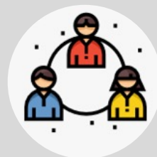
AMALAN KOMUNITI & ALAM SEKITAR