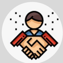
AMALAN RAKAN NIAGA